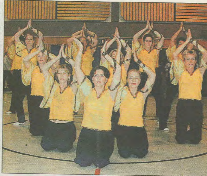
Die „Flashlights“ des TSV 02 Dreihäusen tanzten eine anspruchsvolle, synchrone Choreographie.