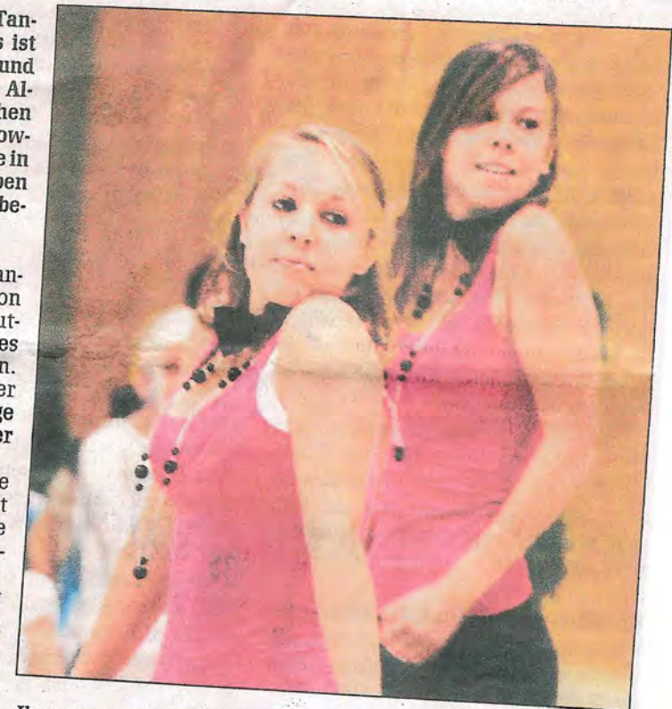
Ihren ersten Auftritt haben die „Freestylers“ aus Marburg-Moischt bei der Matinee in Heskem gehabt.

Und wieder waren es nicht nur die Vereine aus den Gemeinden des Ebsdorfergrundes, die sich den Zuschauern vorstellen wollten. Auch die Tänzerinnen aus Roth/Argenstein, Weimar-Wenkbach, Marburg-Moischt, Münchhausen-Simtshausen und Kirch-