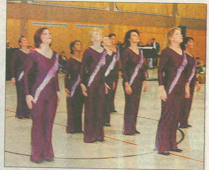
Lebensfreude vermittelte die Gruppe „Allegría“ aus Hachborn getreu der Bedeutung ihres Namens.