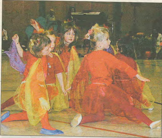
Die „Schneeflocken“, verkleidet als Feen des Zaubewaldes, bewegten sich im Saal mit schwingenden Tüchern.