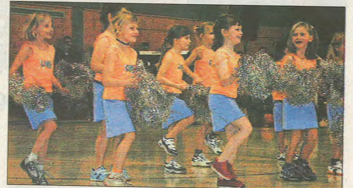
Die kleinen Cheerleaderinnen verzauberten das Publikum.

Akrobatische Einlagen mit einer Mischung aus Jazz und Hip Hop präsentierten die talentierten Tänzerinnen des TSV Wittelsberg, die in diesem Jahr die Turngaumeisterschaften Lahn-Dill gewonnen haben. Von hohem Niveau war auch die Tanzvorführung der „Flashlights“ vom TSV 02 Dreihäusen, bestehend aus ein Medley aus Liedern von Celine Dion. Die jungen Künstler der „Cool Boys“ rockten in ihrem Show-Medley und animierten das Publikum.