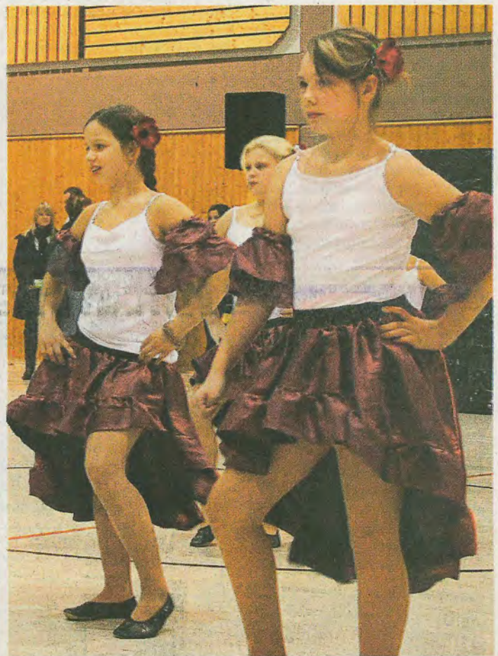
Die jungen Tänzerinnen gehören zum TSV Dreihäusen.