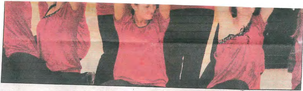
Mit ihrem Showtanz brachten die „Blue Whites“ des SC Roth/Argenstein mächtig Schwung in die Sporthalle von Heskem.